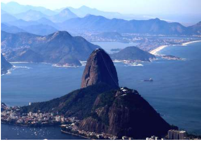
Peñasco Pan de Azúcar en Río de Janeiro, Brasil