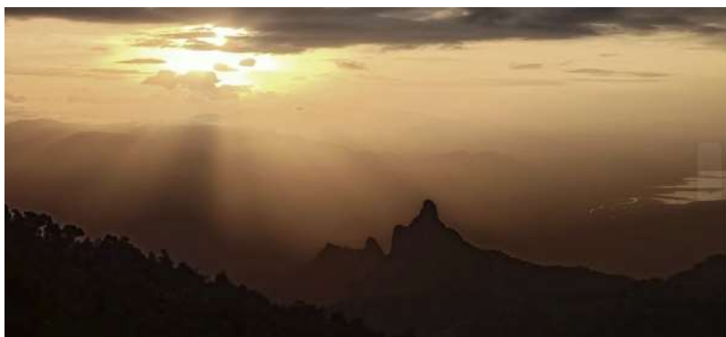
Master Mountain, Nilagiris