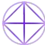
Imagen compuesta por Ludger Philips.

La imagen es una visualización de la plegaria del "Master CVV Sharing": https://worldteachertrust.org/es/web/meditation/master_cvv_sharing