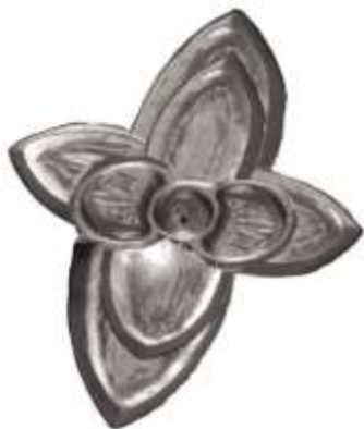
Narayana – Loto de 8 pétalos (2 pétalos en 4 capas – en ángulos rectos entre si)